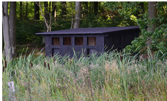
Fugleskjul i sort

Når jeg cykler videre rundt og lader øjnene vandre fra de våde lokaliteter til de tørre, altså mod områderne med græs, bliver jeg en del bekymret. I randområderne, hvor græsset møder skoven, kan jeg se, at mange