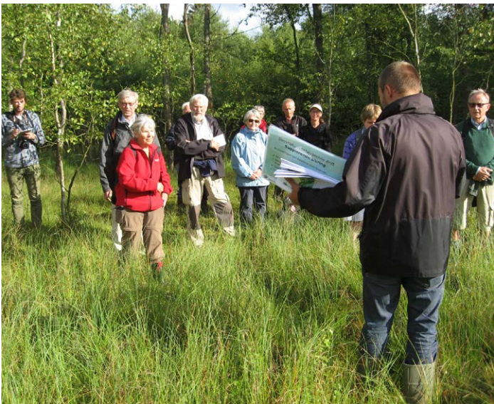
På hængesæk i Fandens Hul

Naturstyrelsen har for hvert Natura 2000 område lavet en første overordnet naturplan, som beskriver målene for arterne og naturtyperne. På baggrund af naturplanen har Kommunen lavet en handleplan for de om-