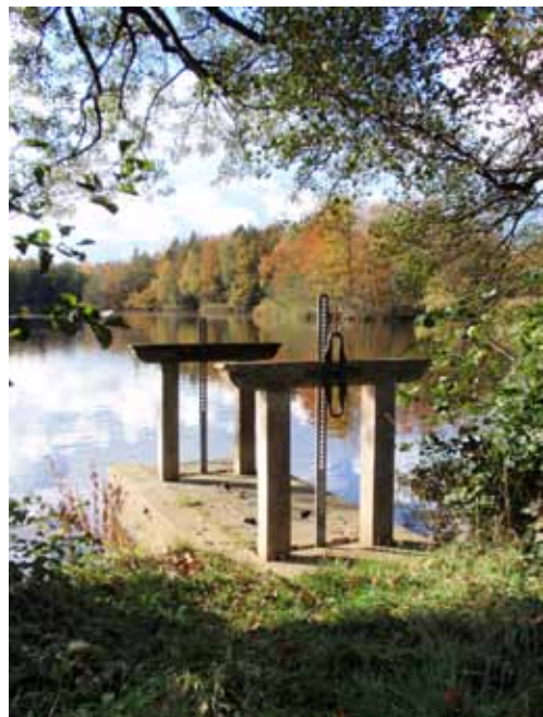
Stignbordet regulerer vandstanden i dammen