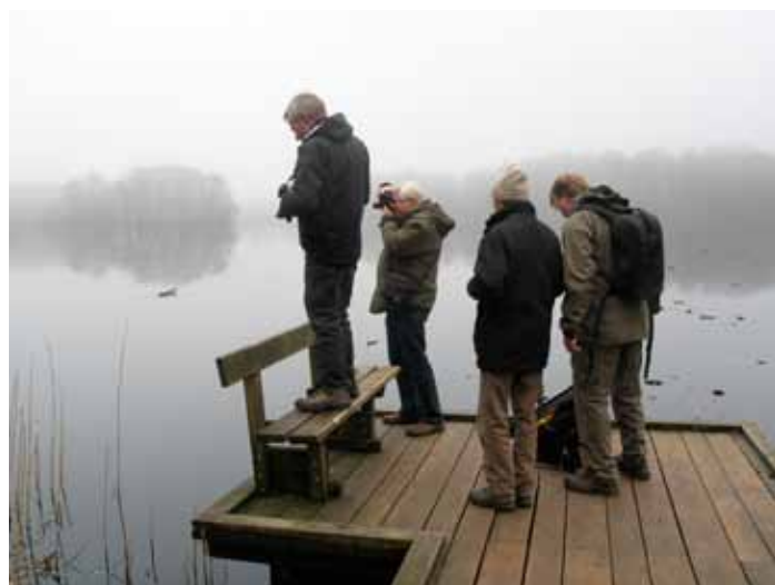
På en diset dag