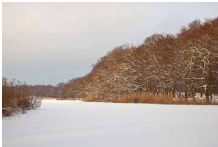
Vinteren er kold, og isen på søerne er tyk. Her ses Bondedammen i januar.

2010 byder også på nye aktiviteter. Nævnes kan at foreningen for første gang arrangerer en bustur til Skåne under temaet traner, og at vi har indledt samarbejde med Skov- og Naturstyrelsen Øresund om naturformidling ved Pernillesø og P-pladsen ved Avlsgården.