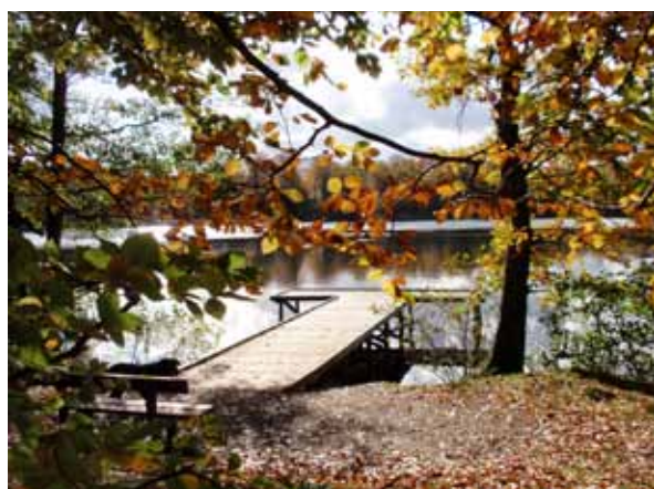
Den nye fiskebro er handicapvenlig