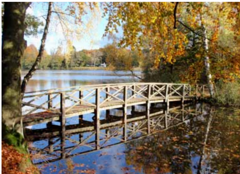
Den måske smukkeste udsigt over Kobberdammen. Motivet blev en overgang brugt af TV Lorry som optakt til udsendelsen.

En dejlig og inspirerende vandretur i det historiske Hellebæks skønne natur er til ende.