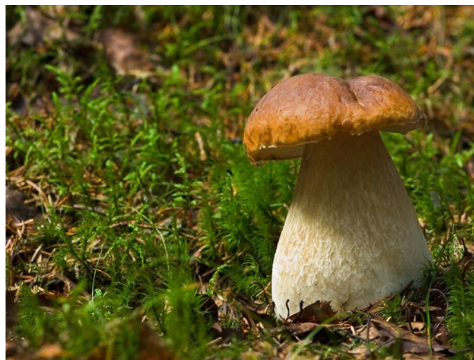
På foreningens svampetur kikker vi efter spiselige svampe, som for eksempel denne Karl Johan.

Undervejs stopper vi op og taler om vores fund. Ved hjemkomst til Avlsgården vil svampene under indtagelsen af en kop kaffe blive lagt frem og gennemgået.