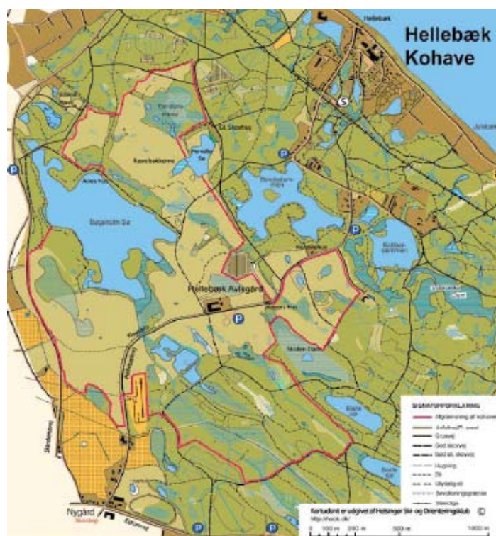
Kortet fra den nye folder.

Ved Helsingørmessen i marts i år blev den nye foreningsfolder præsenteret. Vi synes selv, at den både er flot, appetitvækkende og informativ. Hvis vi skal fremhæve en enkelt ting, må det være kortmaterialet. Det er væsentligt forbedret i den nye udgave takket være, en aftale med Helsingør Ski- og Orienteringsklub om tiladelse til at anvende deres kortmateriale.