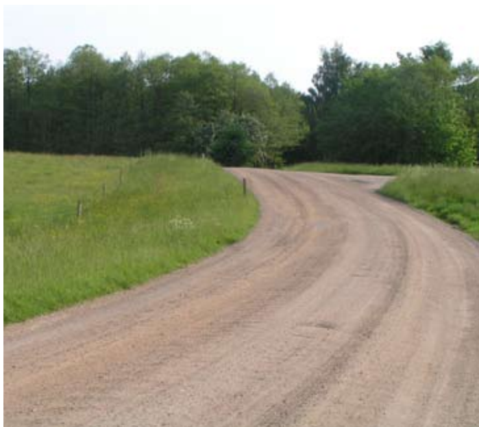
Hellebækvej set mod Roevej til højre i billedet.