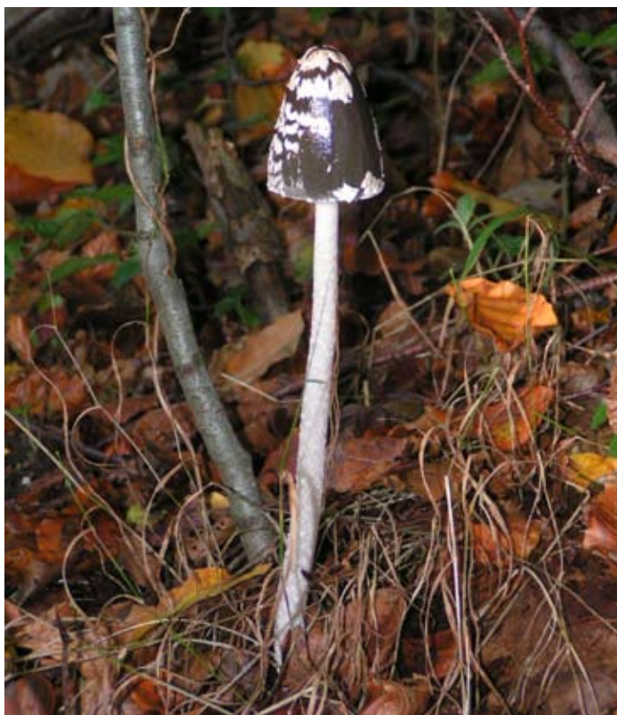
Ikke alle er spiselige, men smukke kan de være.