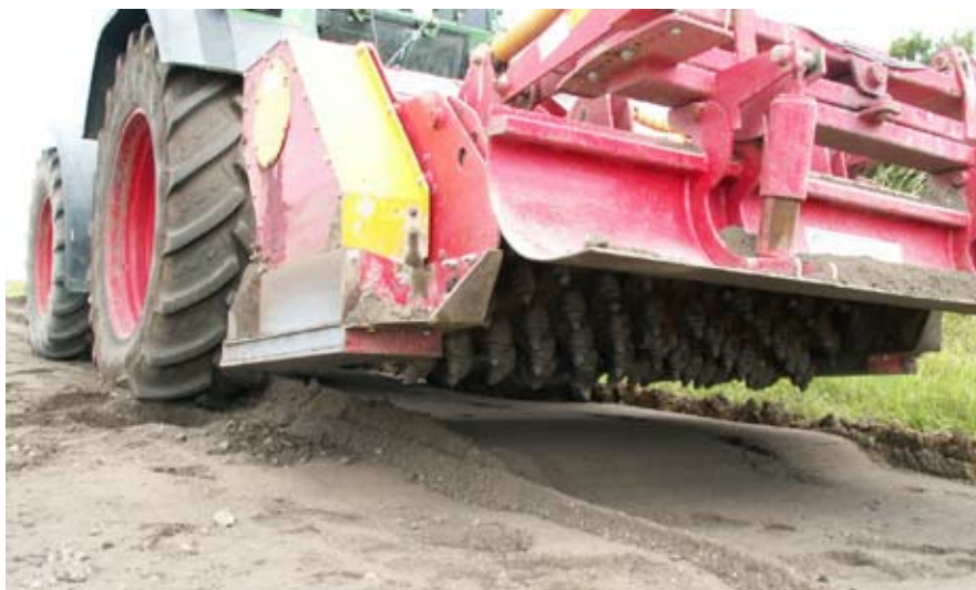
Fræsemaskinen i brug.

Distriktet tror fortsat på visionen og vil arbejde for ønsket om en naturperle som er tilgængelig for alle - på et bæredygtigt grundlag. Skov- og Naturstyrelsen forvalter statens grønne arealer. Hellebækvej er nu en del af et sammenhængende naturområde og ikke længere blot en vej mellem Hellebæk og Nygård – dette er det fremtidige perspektiv.