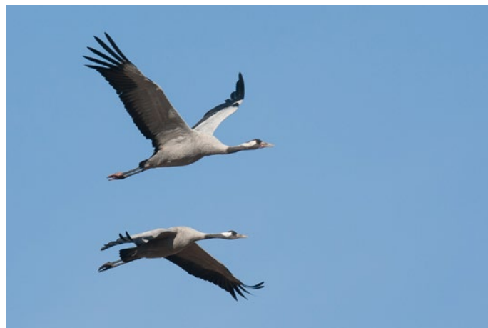
På foreningens traneture har du mulighed for at se disse prægtige dyr passere Kohaven