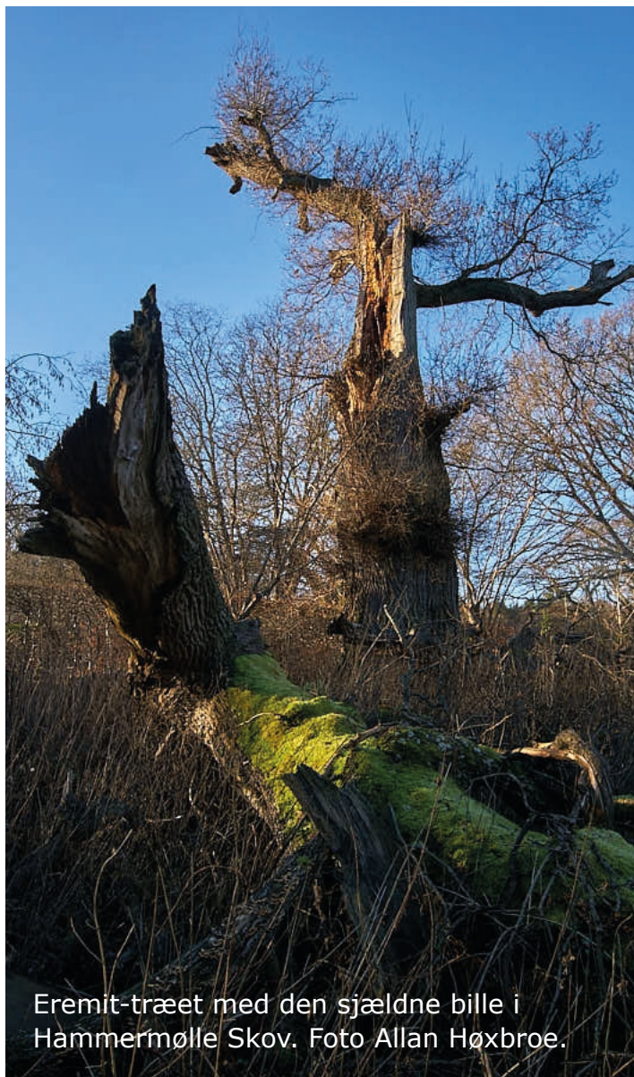
Eremit-træet med den sjældne bille i Hammermølle Skov.

Derefter går vi over til den egentlige generalforsamling. Se dagsorden i den tidligere udsendte invitation på mail eller på hjemmesiden www.kohavensvenner.dk - eller Facebook-grupperne Kohavens Venner og Natur Helsingør.