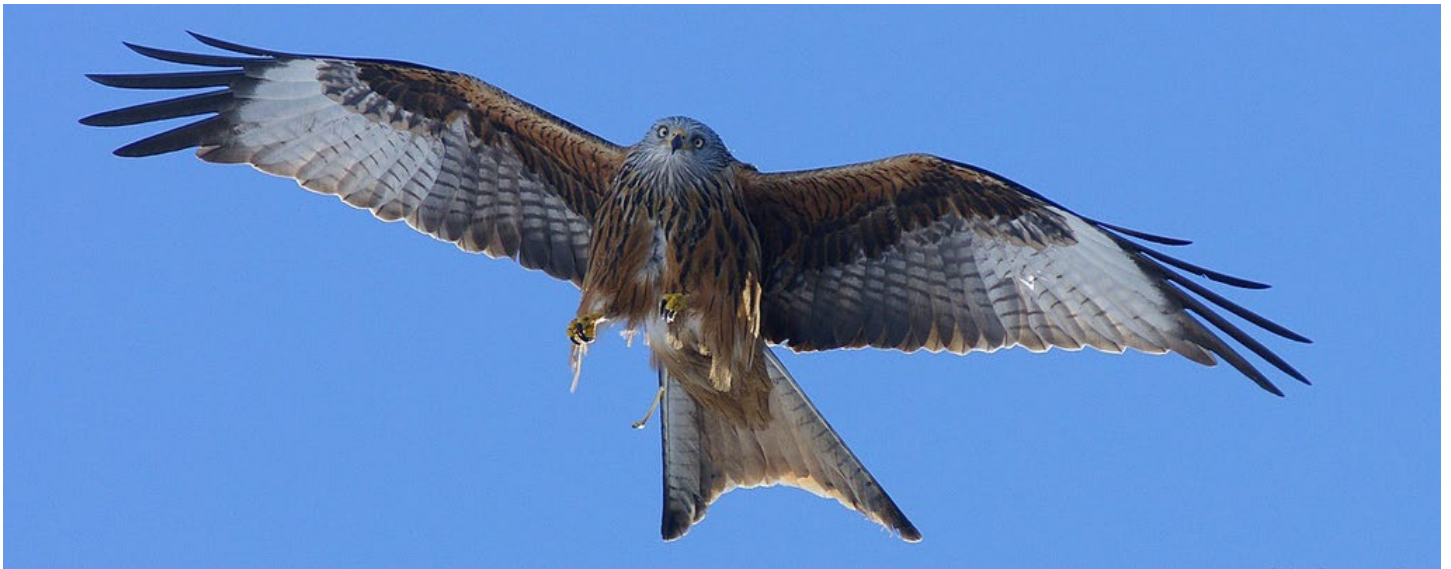
Rød glente. Ses nu næsten dagligt.