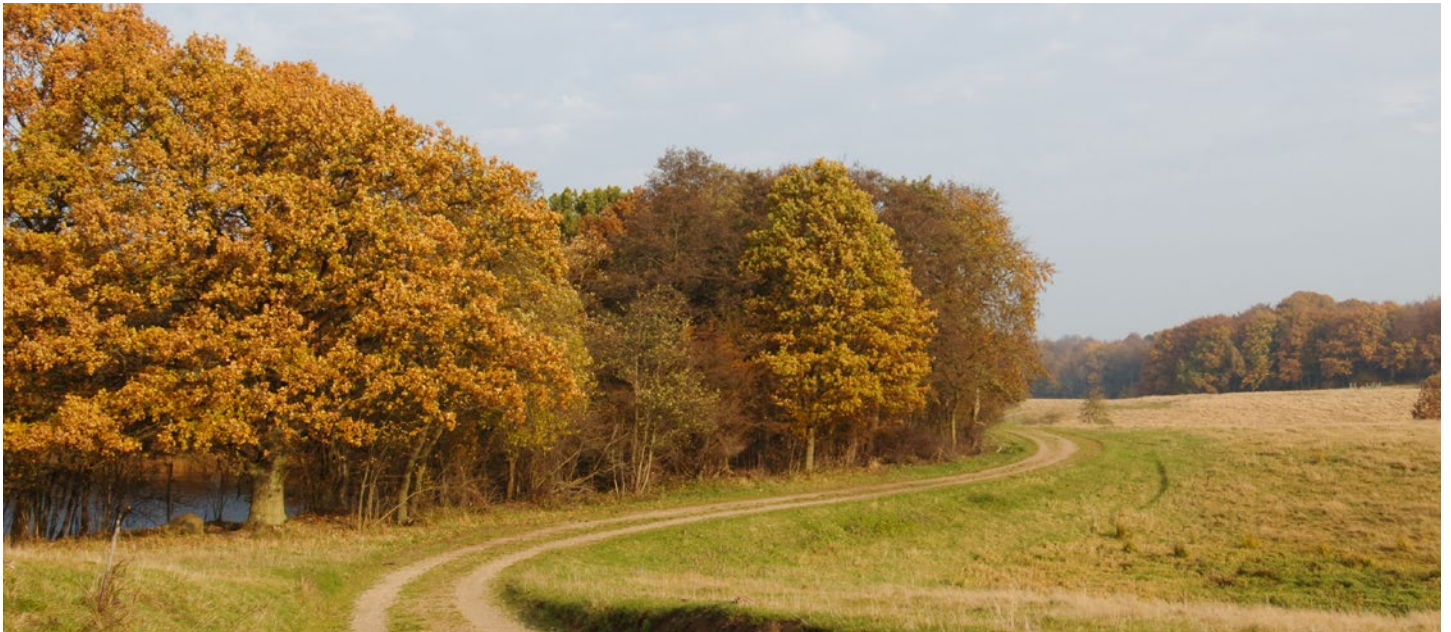
Tag med på efterårets fototur den 24. oktober.