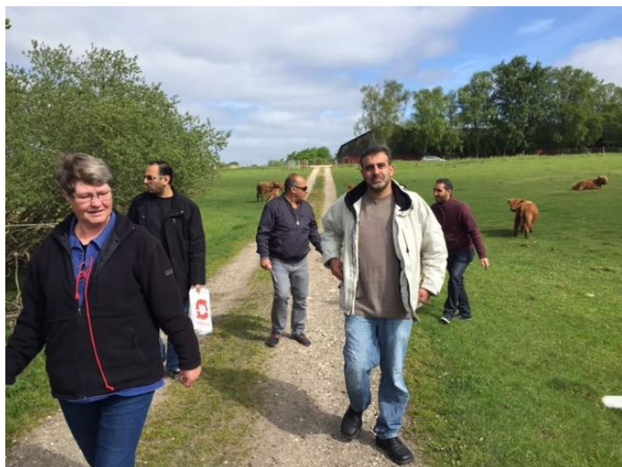
Rundtur i Kohaven.