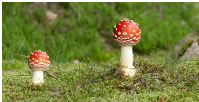
Den røde fluesvamp er smuk men ikke spiselig - på svampeturen kan du lære at finde dem, der kan spises.