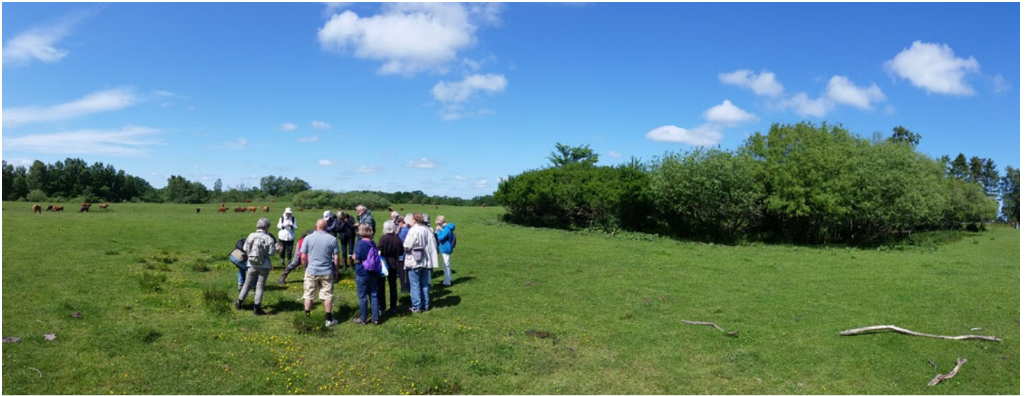
Botanik på sletten: Kohaven er mere artsfattig, end man ville forvente, siger botanikerne. Nu tager Kohavens Venner det op med Naturstyrelsen.