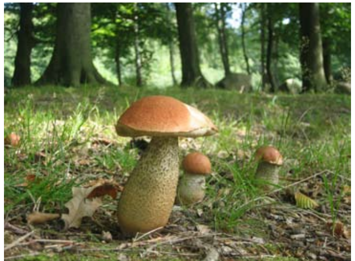
Rørhatte i kilovis.

Ligesom sidste år går vi ned i Teglstrup Hegn og ser, hvad skovbunden kan byde på af spisesvampe. Og mon ikke vi kan være nogen lunde sikre på, at alle får nogle gode svampe med hjem – plus evt. nogle gode råd om, hvordan I tilbereder dem på en spændende måde. I år er alting kommet tidligt, men der vil stadig være godt med svampe i oktober, hvis ellers vejret forbliver lidt lunt – nok især tragtkantareller.