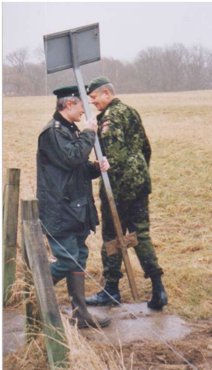
Skovrideren fjerner Forsvarets gule skilt "Adgang forbudt"

Lørdag den 1. marts 2003, præcis 2 år efter at forsvaret havde forladt området, afholdt Hellebæk Kohaves Venner sin stiftende generalforsamling på Hammermøllen i Hellebæk. Et sæt vedtægter blev vedtaget, og en bestyrelse blev valgt. Foreningen var nu en realitet.