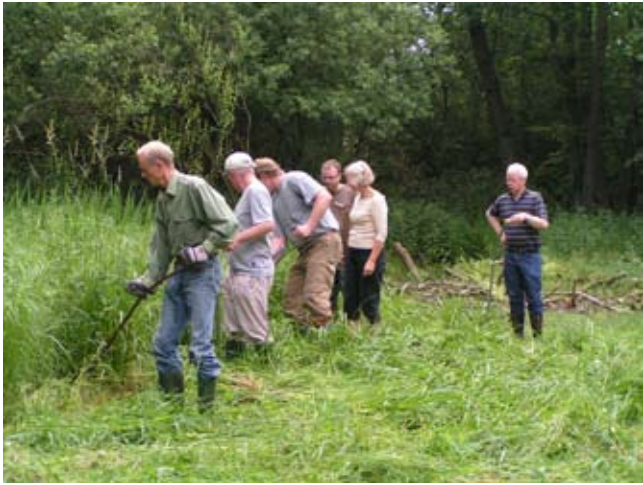
Høstlætlaugget arbejder for frokosten

Vores seneste udstillingsidé er kunstudstillingerne, hvor man kan købe kunstværkerne. Lige nu planlægger vi en udstilling med kunstgruppen DANE, der også udstillede i foråret 2008. De 15 kunstnere skal opholde sig i området og male motiver fra Kongernes Nordsjælland, som senere udstilles hos os. Prikken over i-et er en bog med tekst og motiver herfra.