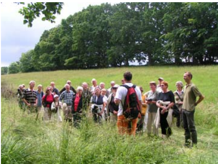
De vilde blomsters dag

Der er meget, der ikke er nævnt i denne korte gennemgang. Udstillingen over korridorer i Nationalpark Kongernes Nordsjælland, rovfugleudstillingen, skolebesøg, redekassebyggerier, julefrokoster osv. Vi har mod på meget, men behøver hjælp til det, og vi glæder os over, at en del har lyst til at deltage som aktive medlemmer, vi kan trække på ved forskellige lejligheder. Vi har nu 300 medlemmer, og det stopper forhåbentlig ikke med det. Tillykke til medlemmerne og det grønne forsamlingshus!